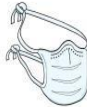
Máscara Cirúrgica (paciente durante o transporte)