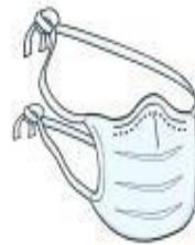
Máscara Cirúrgica (paciente durante o transporte)