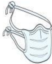
Máscara Cirúrgica (profissional)