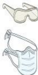
Óculos e Máscara