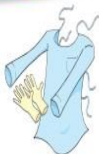
Luvas e Avental