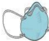
Máscara PFF2 (N-95) (profissional)